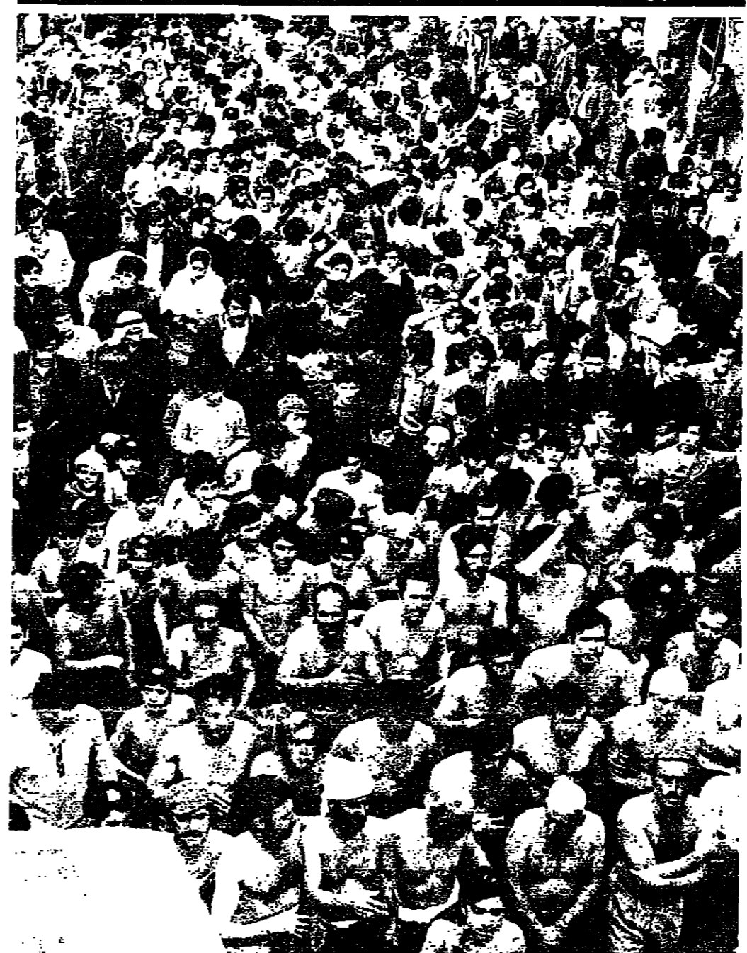
الآلاف من الذين اشتركوا في مسيرة عاشوراء بالنبطية امس